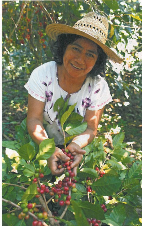
DER PREIS FÜR KAFFEE SETZT SICH AUS DEN EINKOMMEN DER AN DER PRODUKTION BETEILIGTEN MENSCHEN ZUSAMMEN.

Denn diese Wertschätzung für Wertschöpfung gilt immer und überall und nicht nur bei uns. Wenn Sie etwas bezahlen, dann bezahlen Sie immer die Lebenszeit Ihrer Mitmenschen. Weil